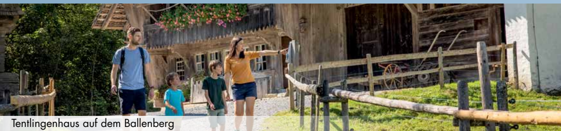
Tentlingenhaus auf dem Ballenberg