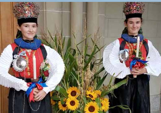
Mädchen in Kranzlitrachten